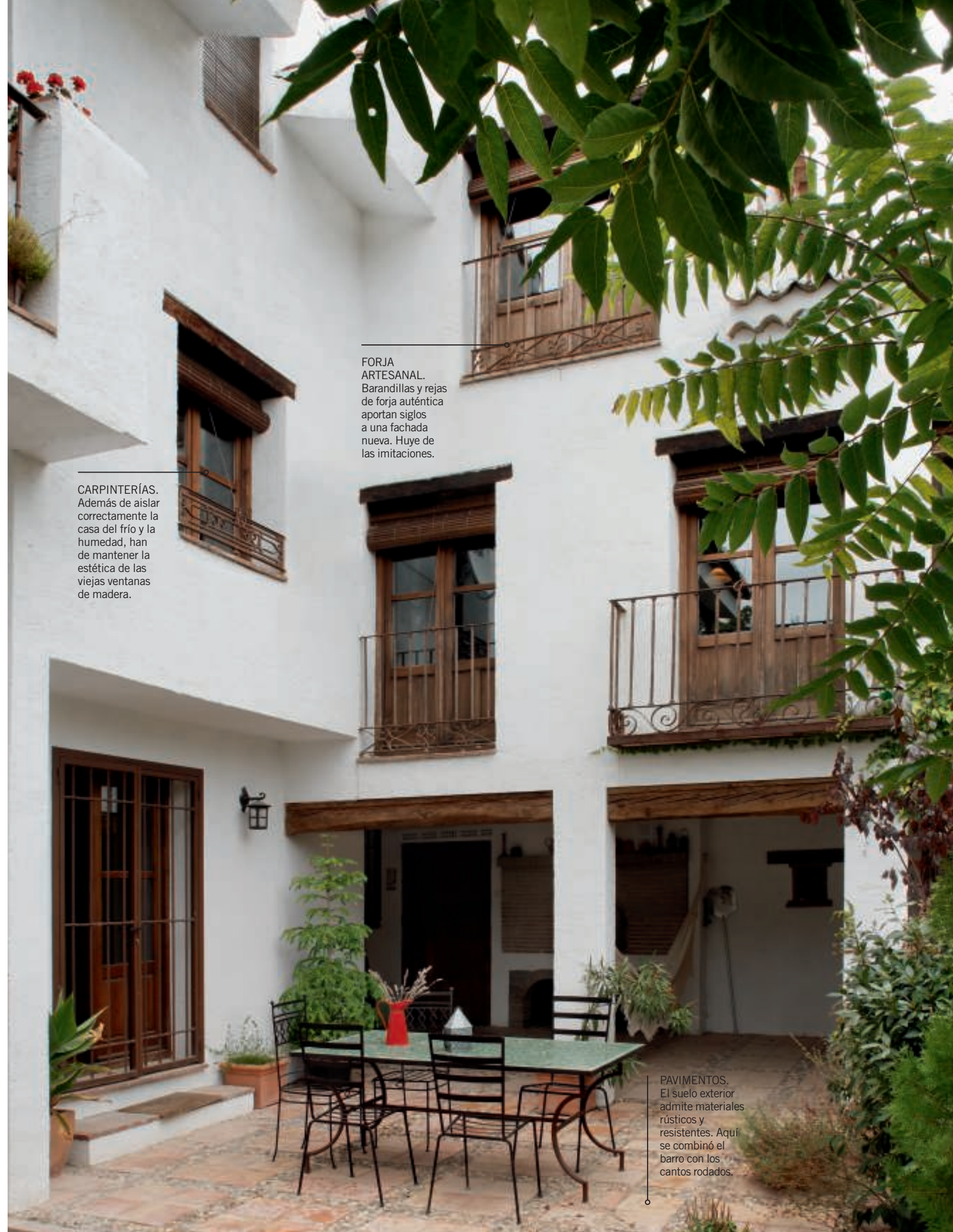
FORJA ARTESANAL. Barandillas y rejas de forja auténtica aportan siglos a una fachada nueva. Huye de las imitaciones.

“Madera, portones, piedra, teja antigua... son fundamentales para lograr una fachada añeja”.